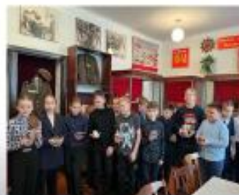
День Защитника Отечества