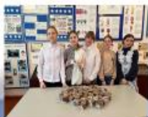
Акция «Блокадный хлеб»

Работали по предупреждению детского дорожно-транспортного травматизма, по профилактике здорового образа жизни учащихся и т.д.